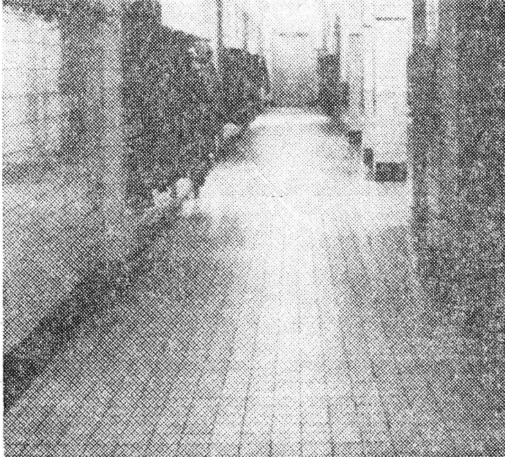
• De benedengang, links stond je voor de klok.

De Raamstraat liep nog door tot aan de Vlamingstraat, evenals de Wagenstraat trouwens, ter linkerzijde voerden het Groenendaal- en Gerbrandstraatje naar de Grote Markt. Rechts liep de Gedempte Raamstraat naar de Wagenstraat. Met de Gedempte Burgwal waren dit de aanlooproutes van de leerlingen naar school. Aanvankelijk zat er niet veel groei in het leerlingenaantal. Daar kwam rond 1890 verandering in. Zes jaar eerder was er al iets revolutionairs gebeurd: de instelling van een paas- en kerstvakantie. Wederom hoofdschuddende ouderen. Menigeen sloeg zich ook weer voor de kop toen in 1899 een drietal meisjes zijn intrede op de school deed. De eerst ingeschrevene was mej. Olivier,