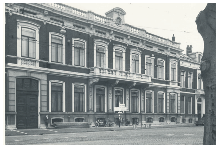
Gemeenteraadszaal Javastraat 26.

gestuurd. Echt waar! Zelf meege-maakt! In de loop van de zestiger en zeventiger jaren werden dit soort dingen steeds minder geaccepteerd. Jongeren kwamen in verzet tegen de autoriteiten en eisten meer vrijheden. Met op de achtergrond Bob Dylan, de Beatles, de Rolling Stones en op het Stevin Lyceum de huisband The Golden Earrings, zoals ze toen nog heetten!