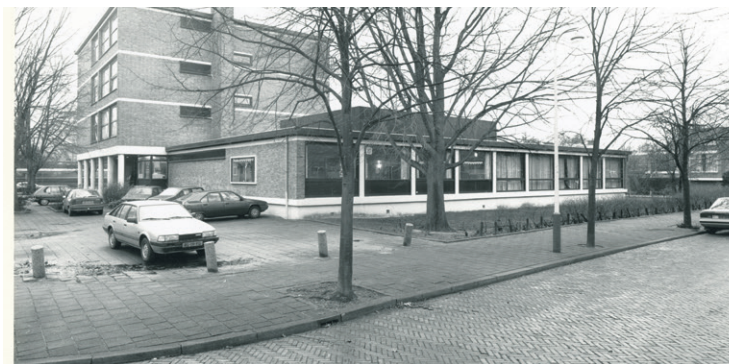
HSA Saffierhorst 105.