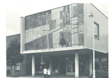
Stevin Lyceum. Zuidlarenstraat 57.