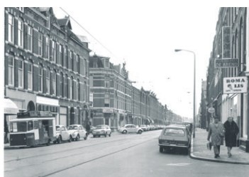
Newtonstraat. Arbeiderswijk!

werd verspreid, werd beschreven wat het HOF wilde. Dat was: het organiseren van het verzet van scholieren tegen autoritaire verhoudingen, prestatiedwang en concurrentie, selectie van de elite, invloed van het bedrijfsleven en onrecht in de rest van de wereld, van Vietnam tot Zuid Afrika. Er werden velerlei acties gevoerd met lessen, discussies en rollenspelen op scholen voor voortgezet onderwijs. Maar ook werd een Shell-benzinestation 'omsingeld' vanwege de Shell-steun aan de Apartheid. Fel werd geïnteresserd bij de HSA toen deze voor de huur van een ruimte voor een vergadering van Dolle Mina 25 gulden dorst te vragen: "Ondanks de pretentie van maatschappijkritiek als wenselijk voor de opleiding en dus voor het academie-instituut bestaat er angst voor een imago dat daaraan beantwoordt. Hieruit volgt dat de AKADEMIE EEN RADERTJE IN DE GOED GEOLIEDE MACHINE VAN HET NEO-KAPITALISME WAS EN IS GEBLEVEN."